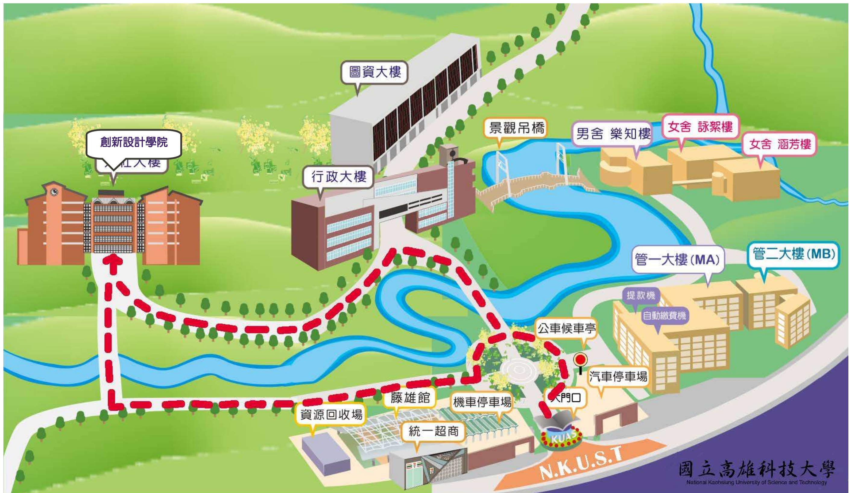
國立高雄科技大學 燕巢校區平面圖(燕巢校區)